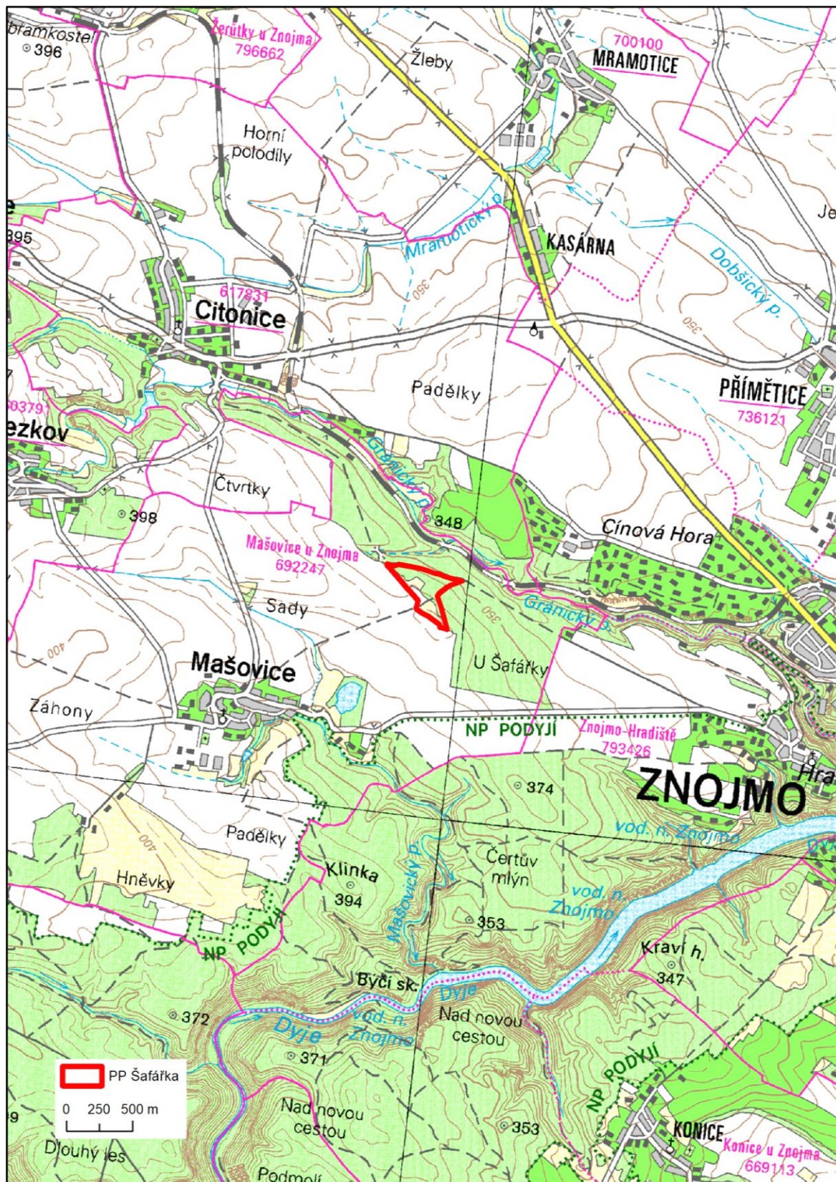
Příloha č. 1: Orientační mapa PP Šafářka