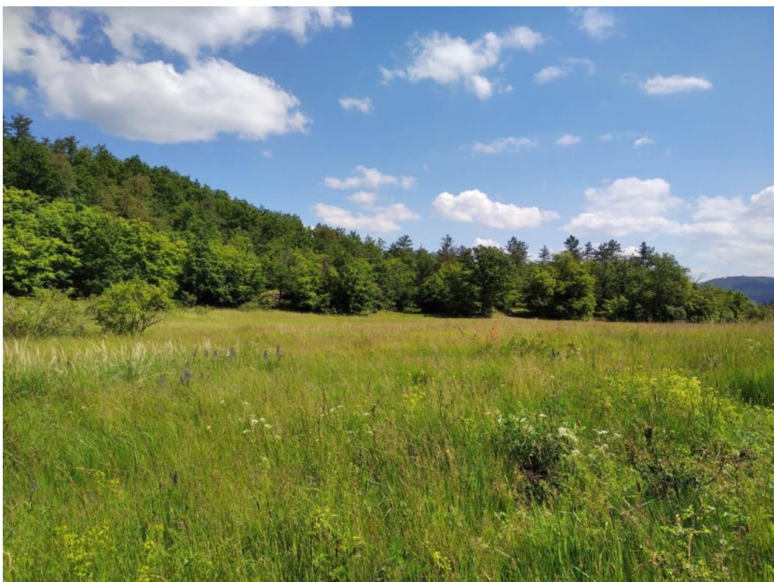
Foto 6: Otevřená západní část DP 2 na hlubší půdě s mírnou expanzí vlčího bobu a vzácným výskytem růže Jundzillovy (1. 6. 2020)