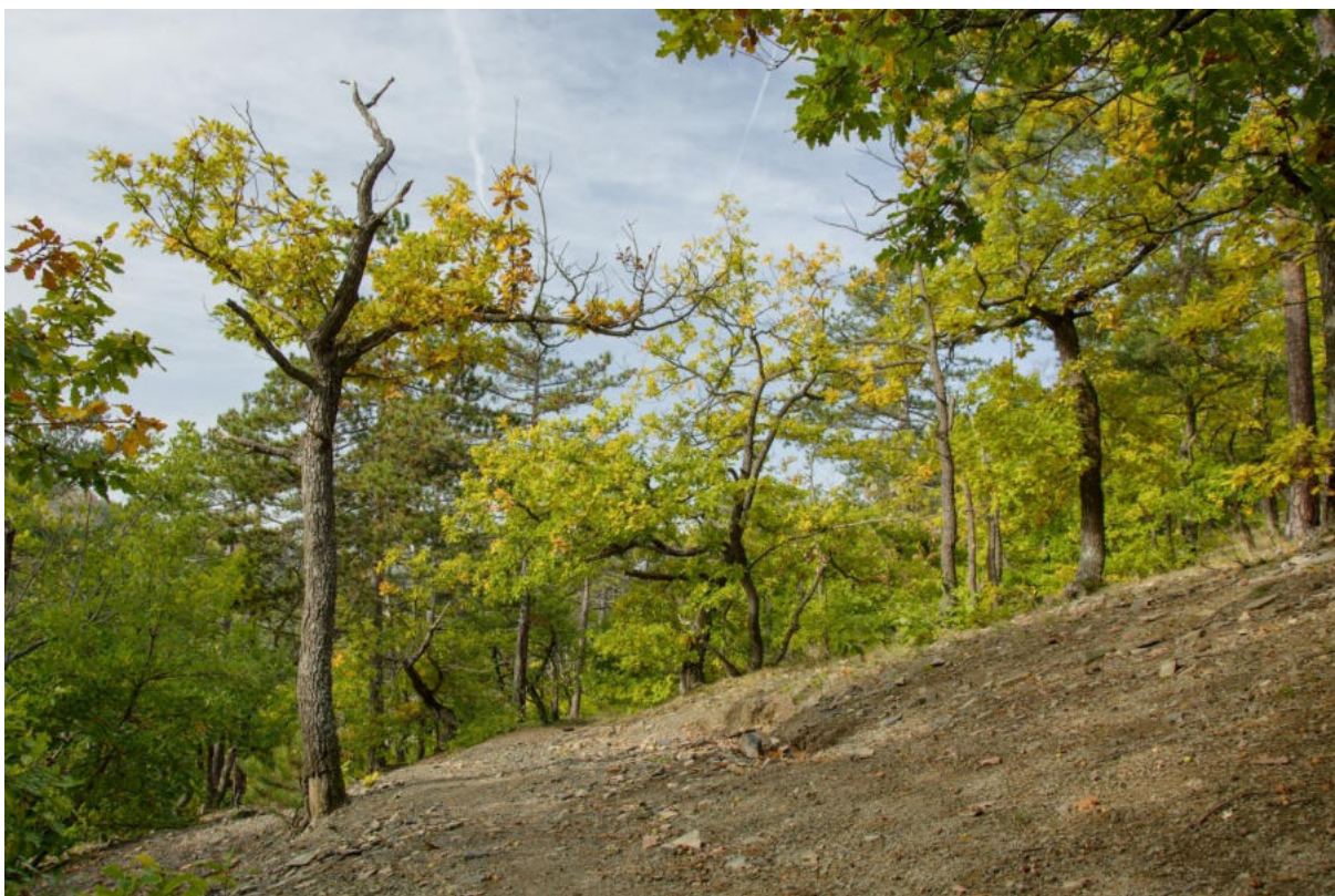
Foto 9: Rozvolněná, místy zakrslá doubrava na břidlicích v DP 64B11-část1 s jeřábem chlumním a narušovanými plochami v okolí pěšiny (hledání trilobitů), 21. 10. 2020