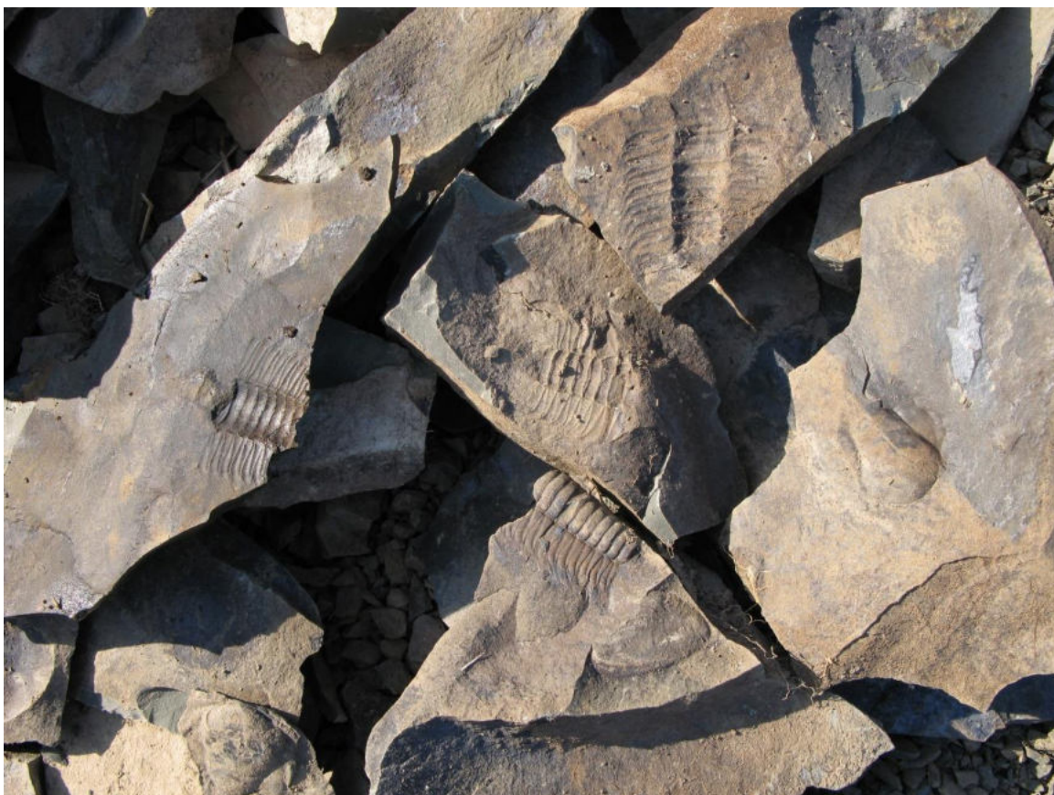
Foto 15: Fragменты zkamenělin odhozené sběrateli (Karel Žák 2011)