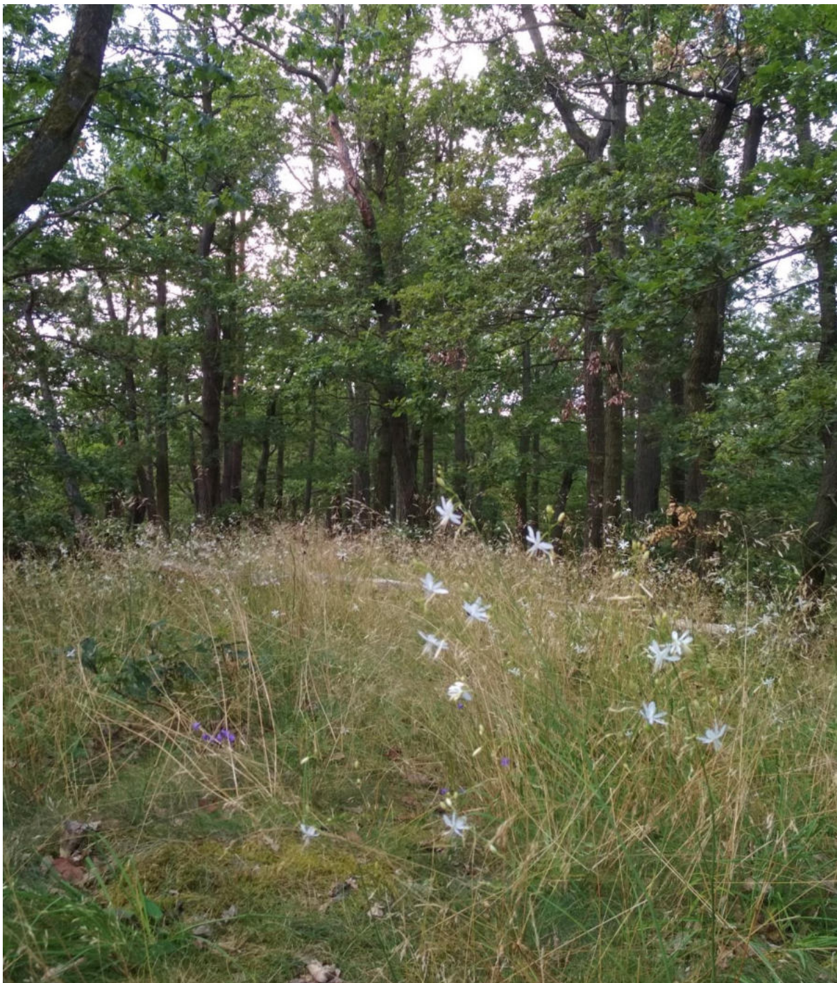
Foto 11: Horní partie hřbítku v DP 64B11-částI hostí teplomilné druhy jako bělozářky liliovitou a větvitou, řimbabu okoličnatou, hrachor černý a další (18. 7. 2019)