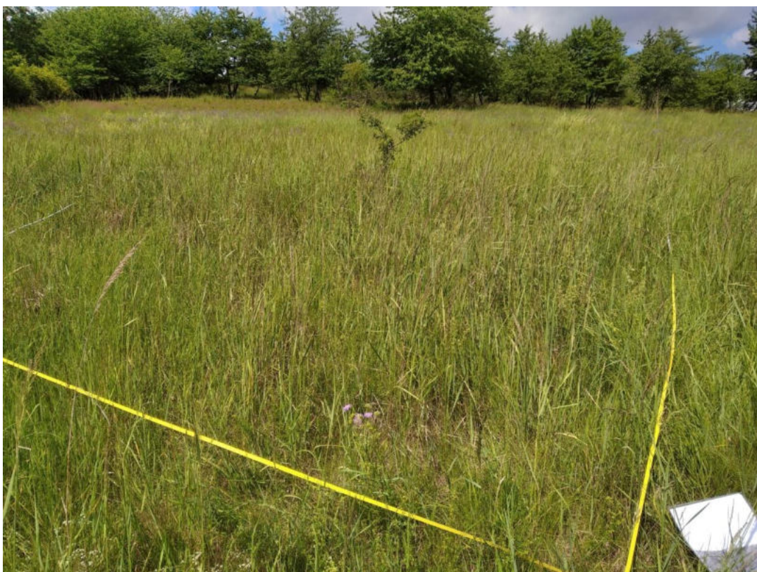
Foto 4: Monitoringová plocha pro sledování managementu ve V části DP1. Na této části stále lokálně dominuje třtina křovištní, roztroušeně se objevují druhy Arrhenatherionu jako chrastavec rolní, mrkev obecná, svízel bílý a další (30. 6. 2020).