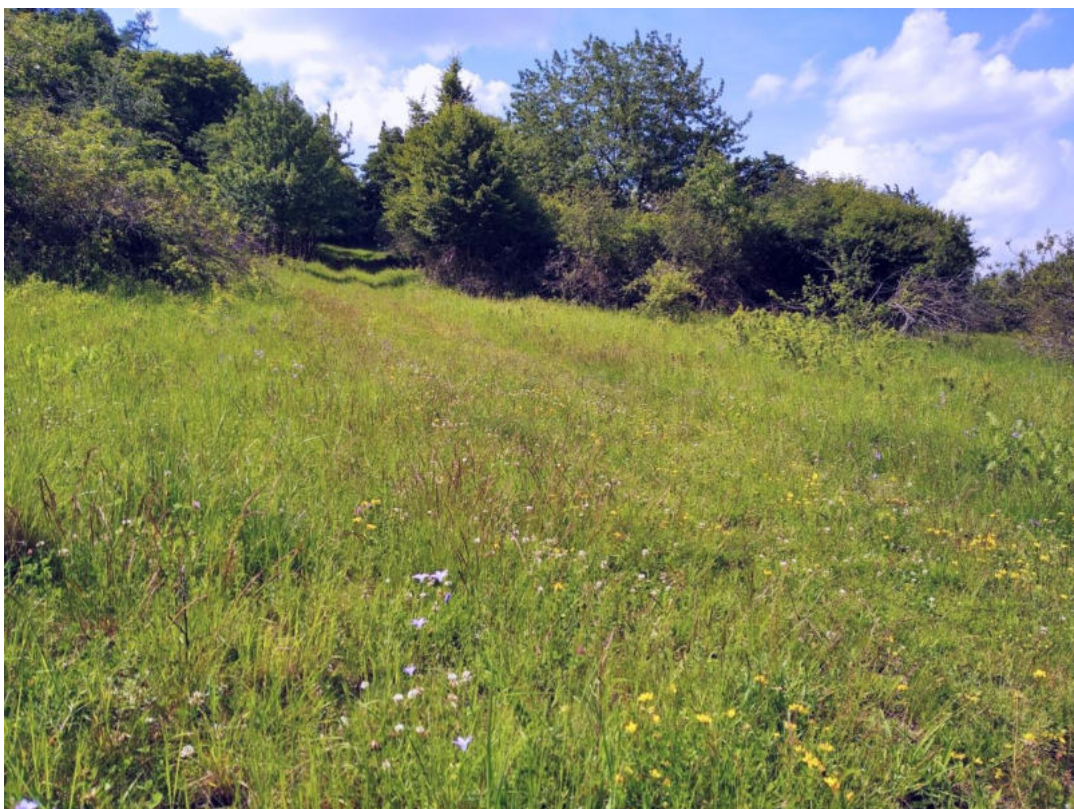
Foto 3: Zapojenější trávníky na hlubších půdách se zvonkem rozkladitým, štírovníkem růžkatým, chrpou luční, chrastavcem rolním a dalšími druhy Arrhenatherionu a Bromionu (16. 6. 2020)