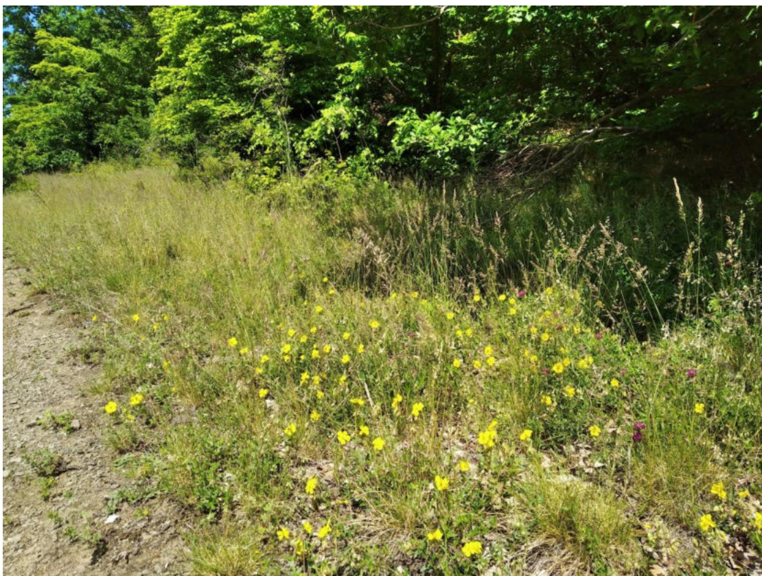
Foto 5: Lemové společenstvo na hranici DP2 a doubravy 64B11 s kostřavou ovčí, devatěříkem velkokvětým tmavým a jetelem prostředním (1. 6. 2020)