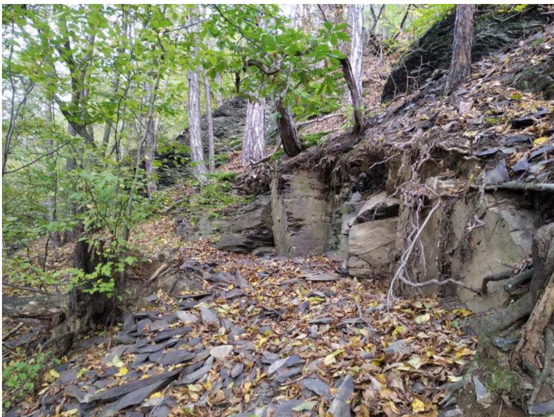
Foto 13: ve střední části DP 64B11-část1 najdeme porosty s dominující borovicí černou a velké množství nelegálních paleontologických odkryvů (21. 10. 2020)