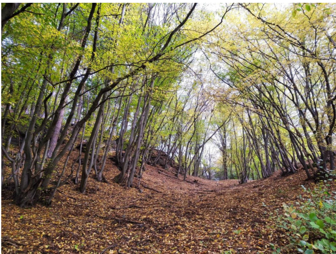
Foto 8: Skalnatá dubohabřina nad potokem v severnější části DP4 s výskytem skalníku celokrajného a lýkovce jedovatého (21. 10. 2020)