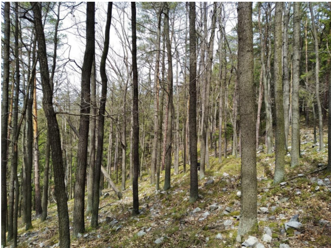
Foto 14: Suchá acidofilní doubrava na slepenci v DP 64A15 s borůvkou, bikou bělavou a metličkou křivolakou