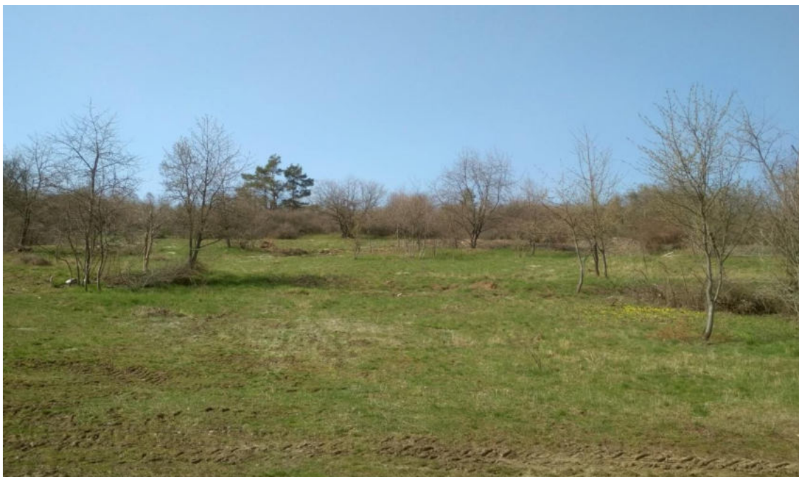
Foto1: Časně jarní pohled do DP 1 z JV úpatí kopce. Vidíme vypasený travník, stopy po výřezích křovin a nelegální paleontologické odkryvy (uprostřed a vpravo na obzoru). 1. 4. 2020.