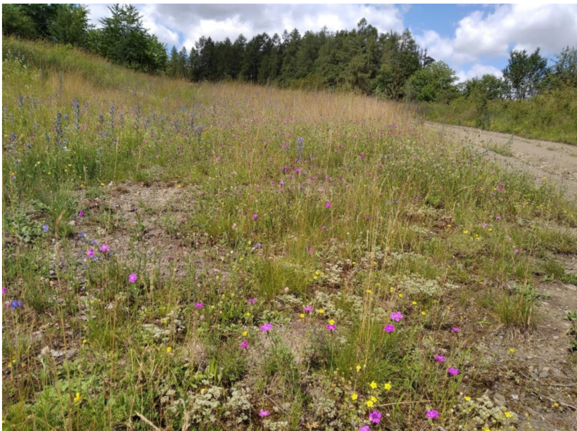
Foto2: Suché acidofilní travníky na mělkých a narušovaných stanovištích s chmerkem vytrvalým, hvozdíkem skvrnitým, mochnou stříbrnou, hadincem obecným, jestřábníkem chlupáčkem, jetelem rolním a ladním a řadou dalších druhů. Vrcholová partie DP 1 při cestě v S části (30. 6. 2020).