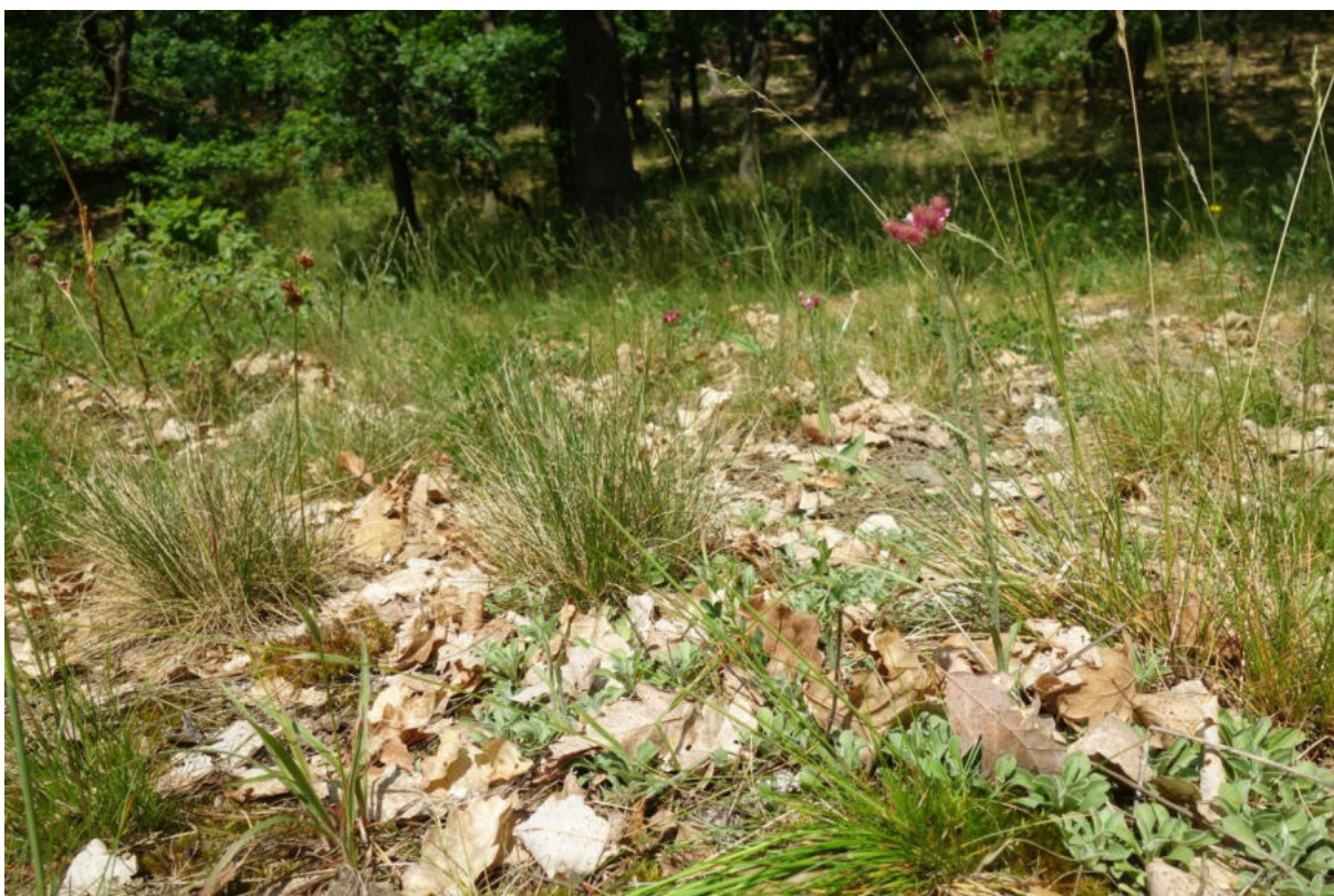
Foto 10: Světliny v doubravě v okolí pěšiny a vyhlídky v DP 64B11-část1 hostí vzácné druhy jako kociánek dvoudomý a vemeník dvoulistý (18. 5. 2018)