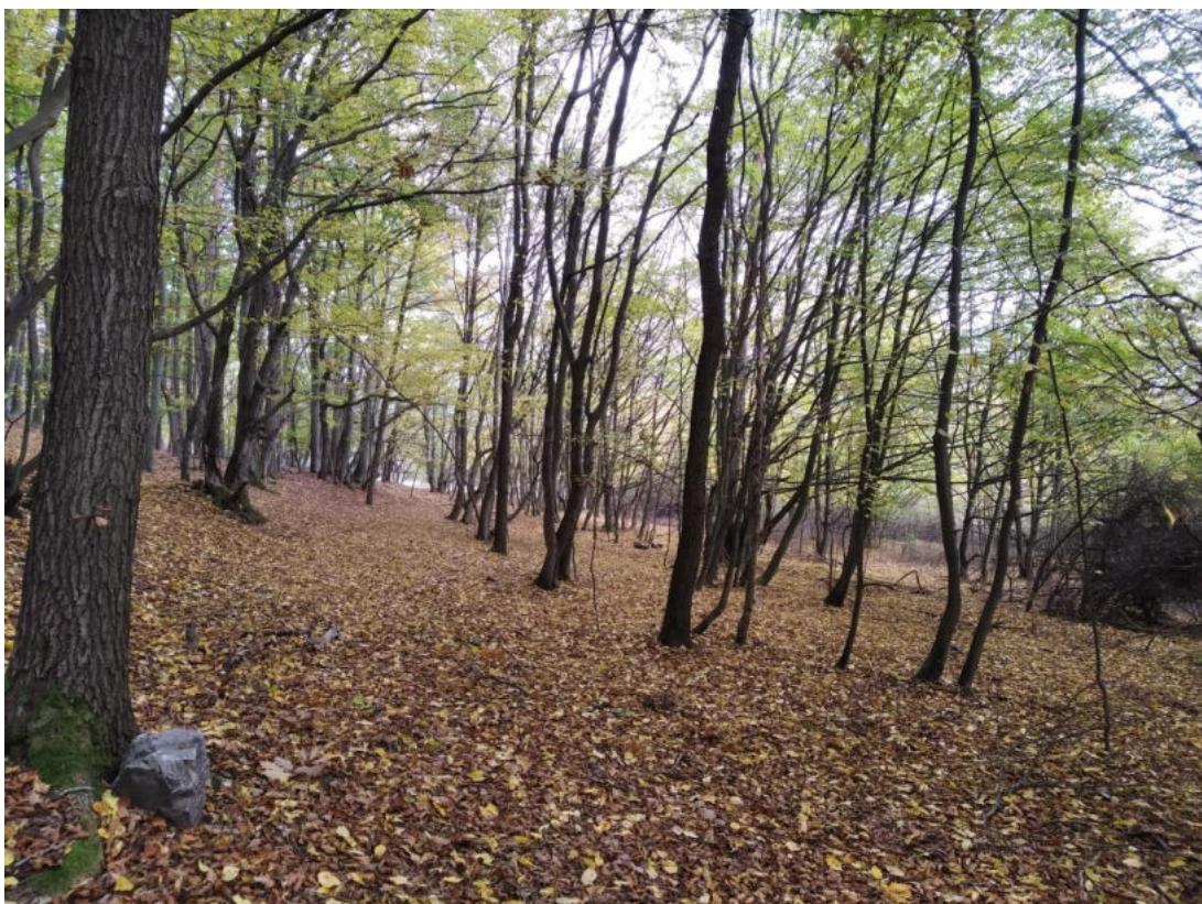
Foto 7: Mezi náletovým lesíkem v DP 3 a dubohabřinou v DP 64B11-část2 a je patrná hranice vyznačená starými hraničními kameny (vlevo), 21. 10. 2020