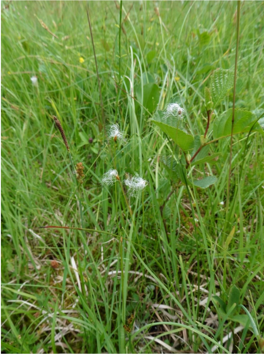
Suchopýrek alpský (seg. 2).