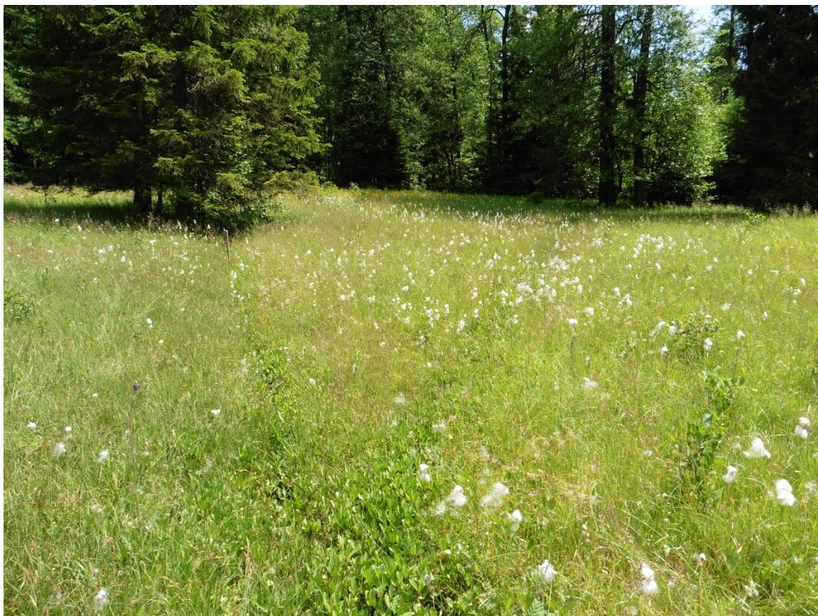
Nejcennější část lokality – nevápnité mechové slatiniště s výskytem suchopýrku alpského, tolije bahenní, vachty trojlisté, pětiprstky žežulníku, kruštíku bahenního a vstavače májového (seg. 2).